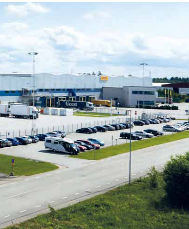
Bilden visar ett representativt exempel på Catenas logistikfastigheter, Törsjö 2:49. Vål lokaliserad utanför Örebro vid Europavägarna E18/E20.

Kontrollaktiviteter genomförs på fastighetsnivå i form av löpande resultat- och investeringsuppföljningar, på övergripande nivå i form av till exempel resultatanalys på områdesnivå, analys av nyckeltal och genomgångar av den legala koncernstrukturen. För att förebygga och upptäcka fel och avvikelser finns exempelvis system för attesträtter, avstämningar, godkännande och redovisning av affärstransaktioner, rapporteringsmallar, redovisnings- och värderingsprinciper. Dessa system uppdateras kontinuerligt. Den interna informationen och externa kommunikationen regleras på övergripande nivå av en informationspolicy. Den interna informationen sker genom regelbundet hållna informationsmöten.