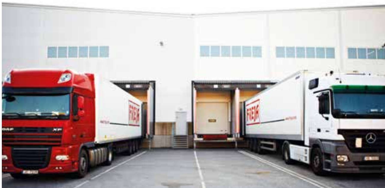
Jordbromalm 4:33, Haninge.

För att förebygga och upptäcka fel och avvikelser finns exempelvis system för attesträtter, avstämningar, godkännande och redovisning av affärstransaktioner, rapporteringsmallar, redovisnings- och värderingsprinciper. Dessa system uppdateras kontinuerligt. Den interna informationen och externa kommunikationen regleras på övergripande nivå av en informationspolicy. Den interna informationen sker genom regelbundet hållna informationsmöten.